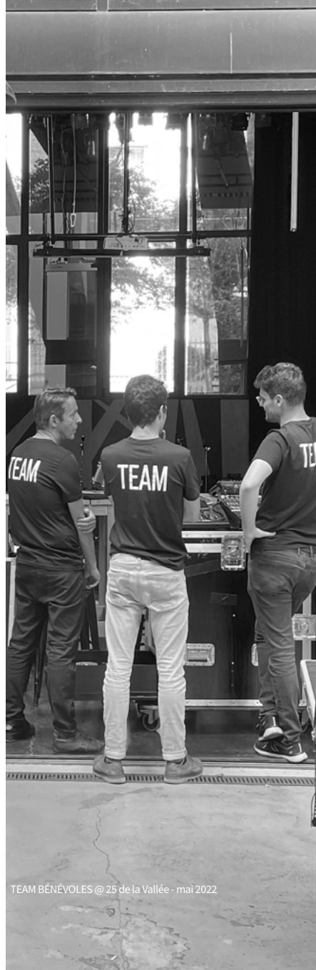
TEAM BÉNÉVOLES @ 25 de la Vallée - mai 2022

Toutes les infos et les réservations sont sur le www.mjcdelavallee.fr