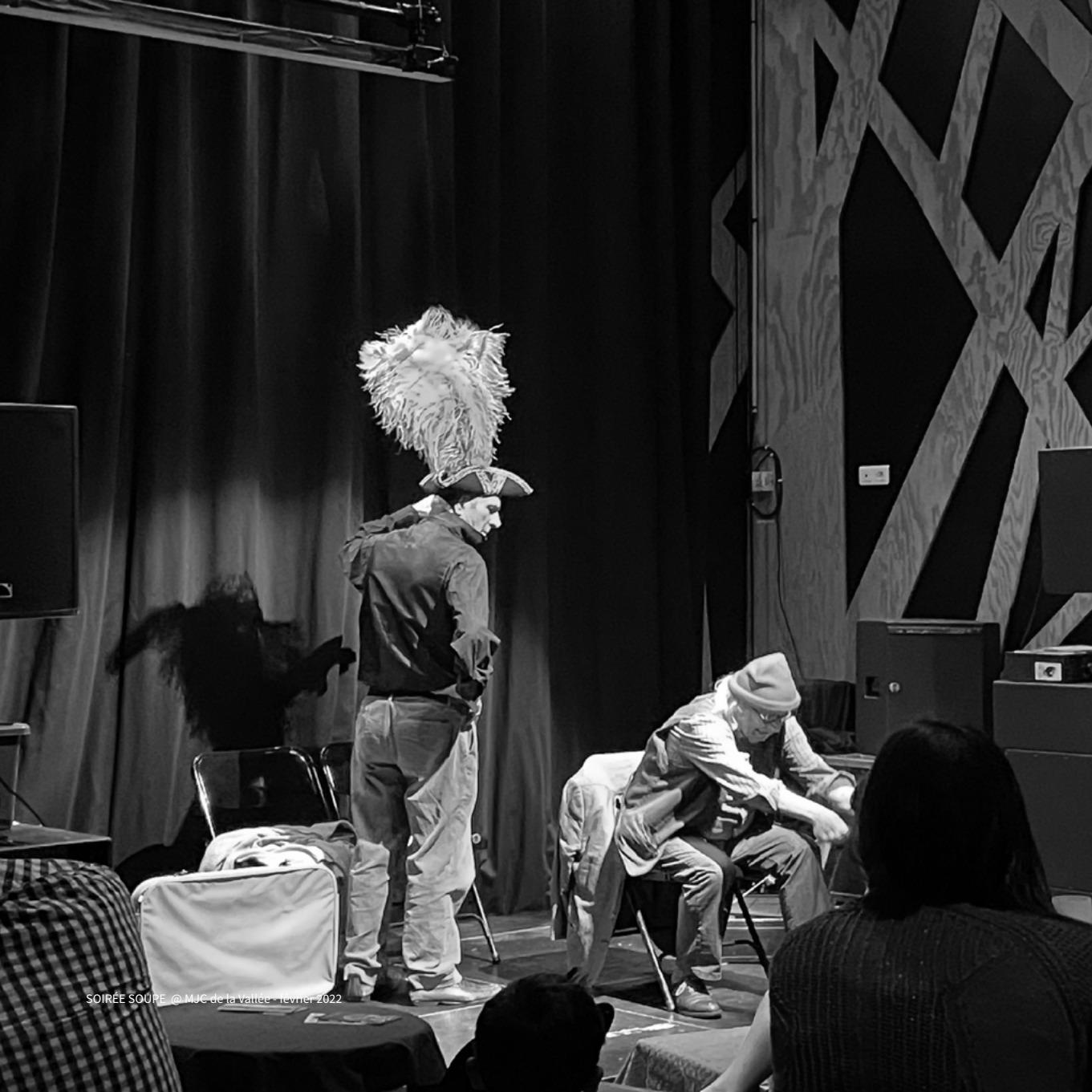
SOIRÉE SOUPE @ MJC de la vallée - février 2022